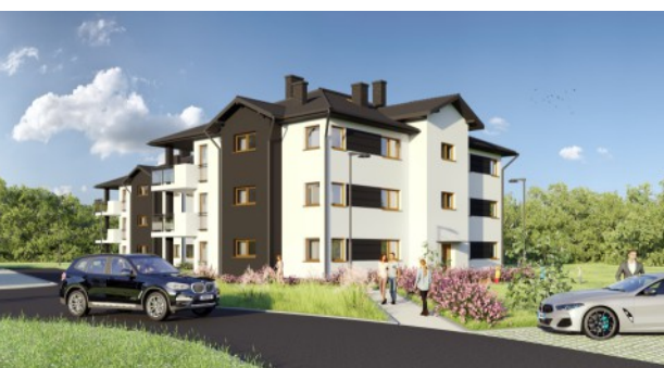
CHRZANÓW Borowcowa / Lwowska